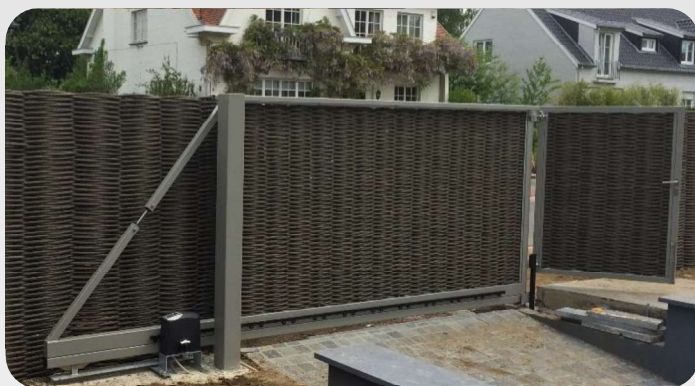
Porte glissante autoportante